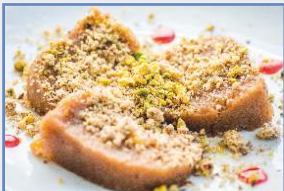
ГРИС ХАЛВА 200 гр. 5.90