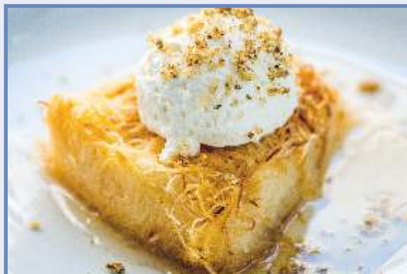
ЕКМЕК /десерт с кадаиф и сметана, изпечен до съвършена хрупкавост, накрая залят с лимонен сироп/ 200 гр. 5.90